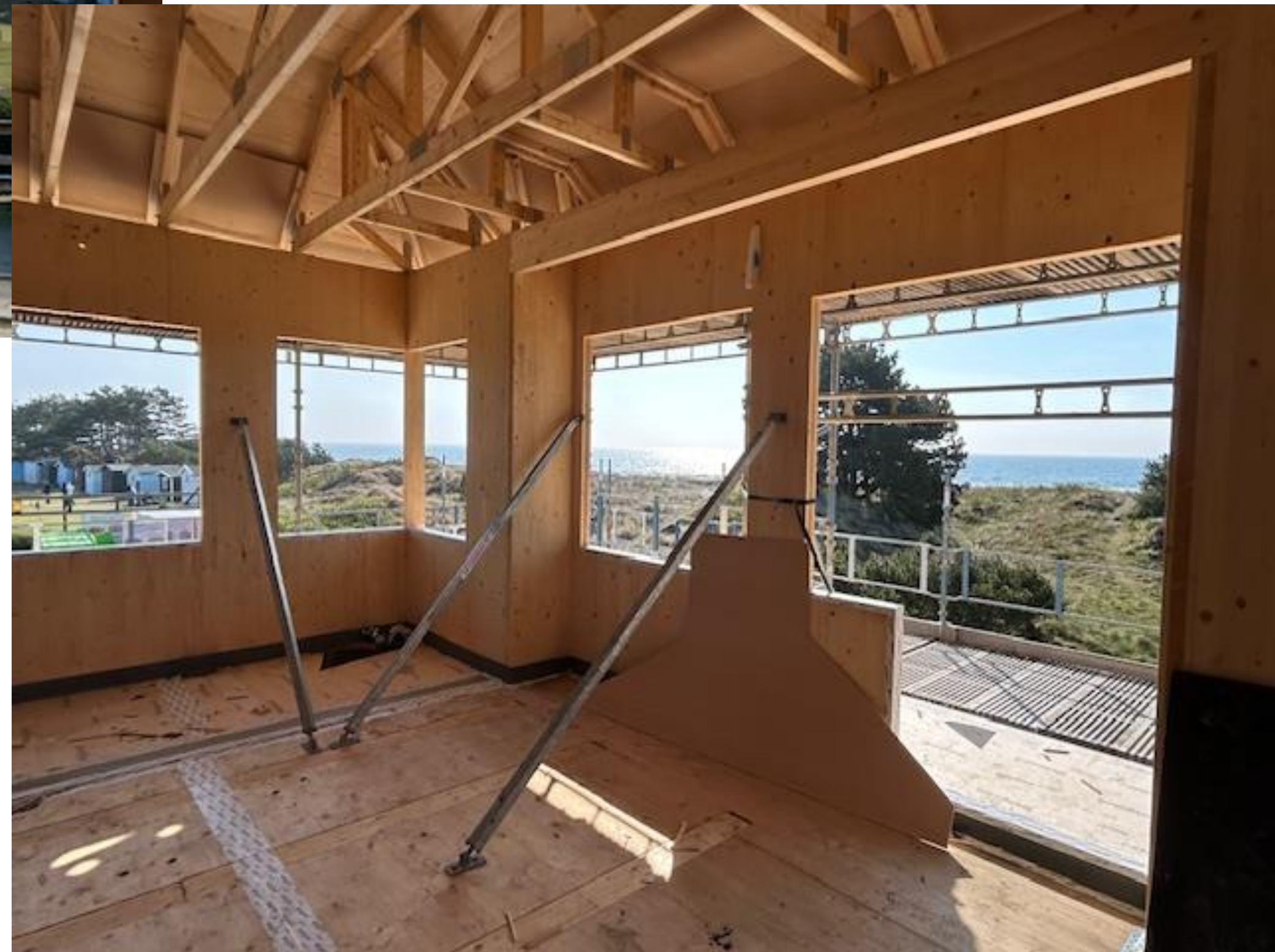
Vy mot söder och Baltiska havet och Kämpingebukten